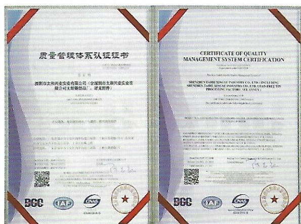
質量管理體系認證證書