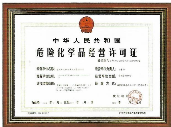
危險化學品經營許可證